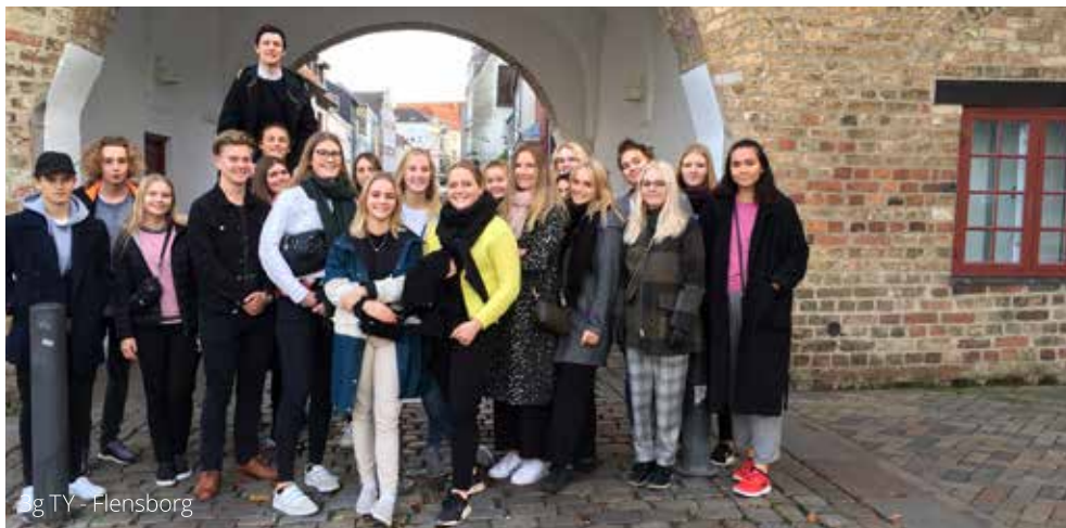
Fig. TY - Hensborg